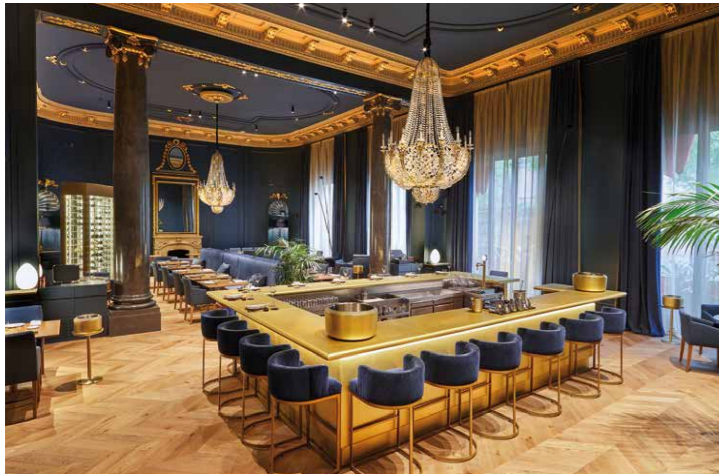
Restaurant «Amar» und Cocktail Bar «Bluesman» des Hotels «El Palace».