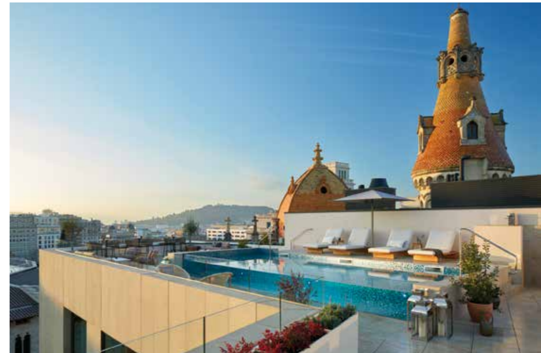
Dachterrasse mit Pool des neuen «Me»-Hotels von Melia. Roof terrace with pool of the new «Me»-Hotel by Melia.