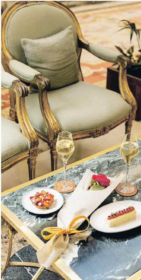
EL PALACE BARCELONA