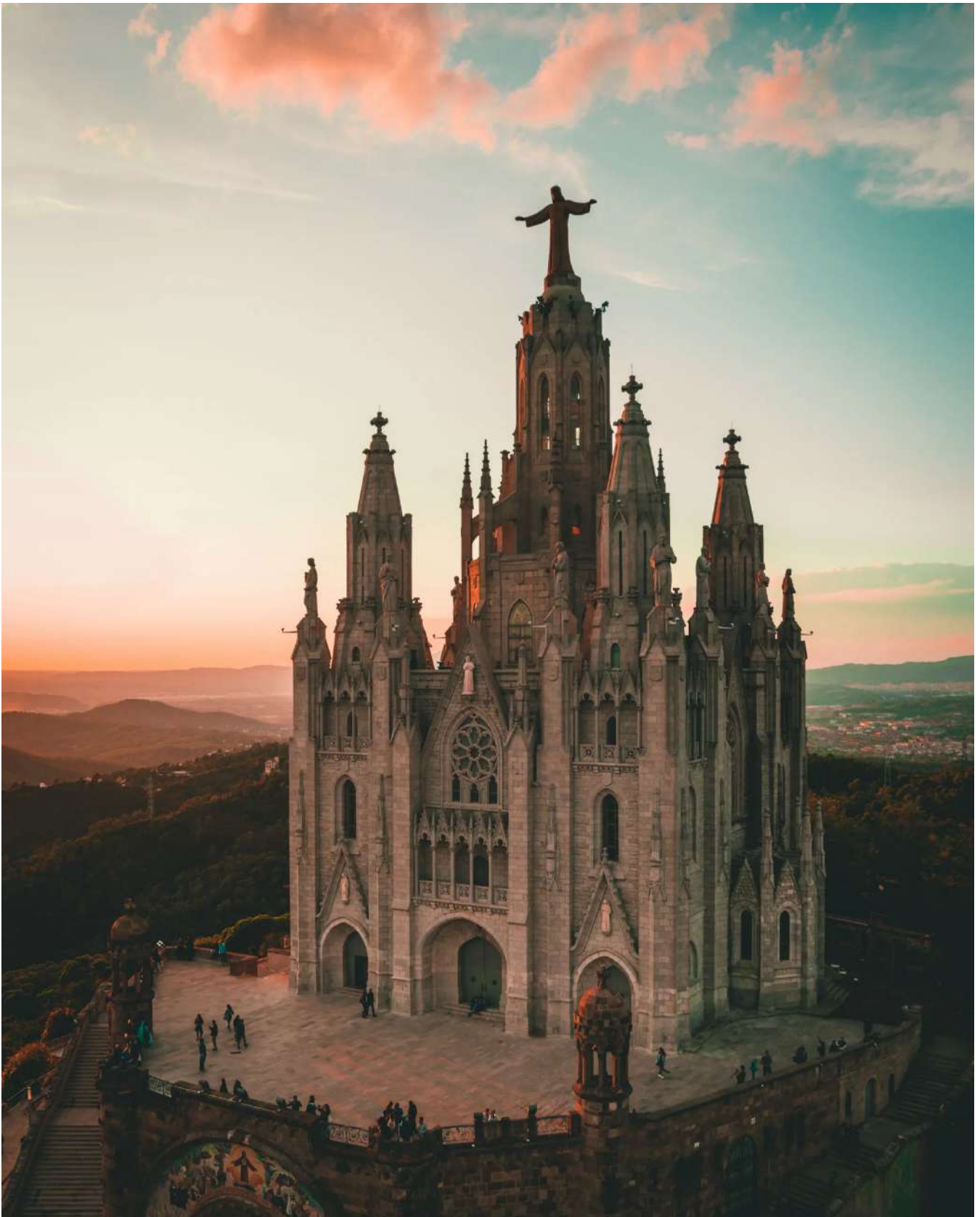
Magia en el Tibidabo.